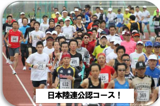
日本陸連公認コース!