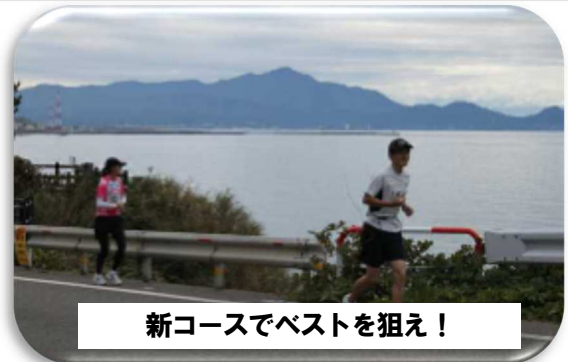
新コースでベストを狙え!