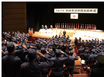
〆消防本部消防総務課