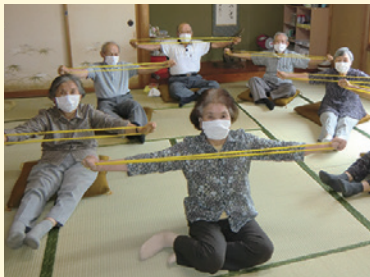
▲コツコツ貯筋体操で健康づくり