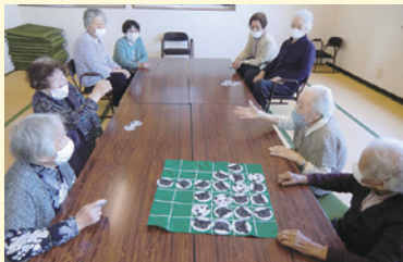
▲ボードゲームで頭の体操