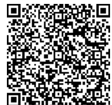
イノシシの目撃情報 二次元コード

昨年度から本市ホームページで公開しているイノシシ出没マップをリニューアルしました。イノシシのアイコンをクリックすると、目撃日時などの詳細な情報が表示されます。イノシシの行動範囲が見える化することで、さらに分かりやすく市民の皆さんに注意喚起します。