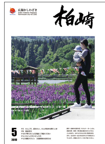
令和元(2019)年 5 月 第 1202 号