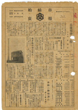
昭和 28(1953)年 6 月 第 1 号