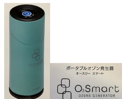
ポータブルオゾン発生器