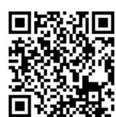
対象製品 情報サイト