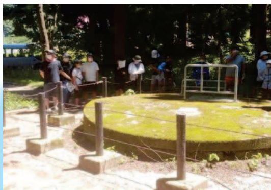
日本で初めてできた集水井