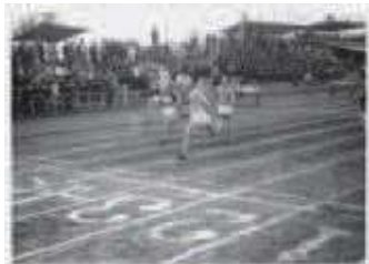
写真: 柏崎市立図書館所蔵 小竹コレクション絵巻書、真貝真一氏撮影