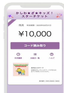
電子チケットのイメージ