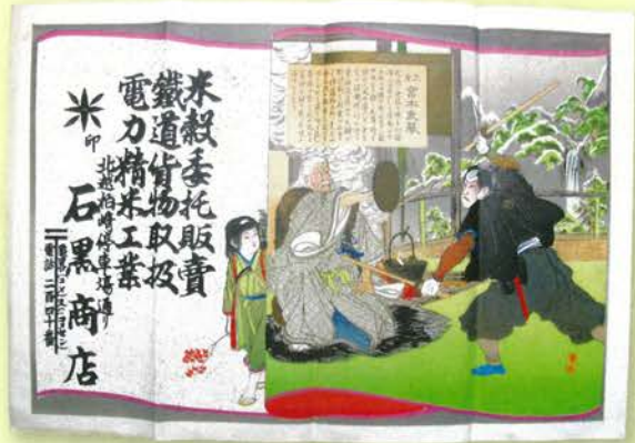
▲神話や歴史を題材とした場面の描写は読み物としても楽しませてくれました。(当館蔵)