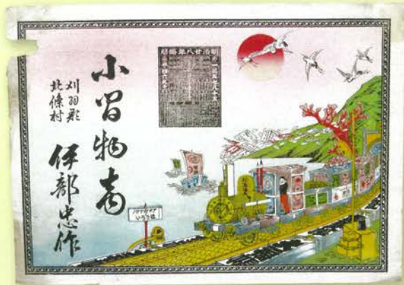
▲お金でできた列車がソロバンの線路を走る。ユニークな図柄も特徴です。(個人蔵)