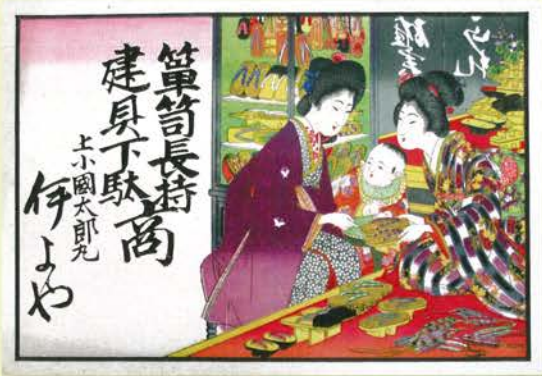
▲商店の店先での様子が色彩豊かに描かれています。(当館蔵)

本展では、柏崎をはじめ県内各地の引札を展示し、そこから見える人々の暮らし、興味や関心、願いなどを読み解きます。あわせて、印刷や広告の歴史の一端についても紹介します。見ているだけでも楽しい、華やかな刷り物の世界をお楽しみください。