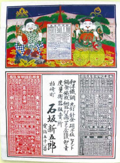
▲暦や郵便物早見が掲載された引札は実用的で重宝されました。(当館蔵)