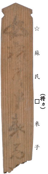
☆ 蘇 氏 (将カ) 米 子