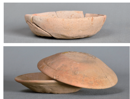
土師質土器 [馬場・天神腰遺跡 (上)・柏崎町遺跡 (下)]