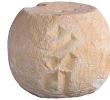
五輪塔 (水輪) [小兒石遺跡]