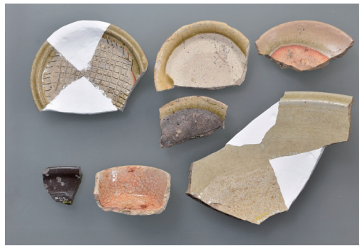
瀬戸美濃焼 [柏崎町遺跡]