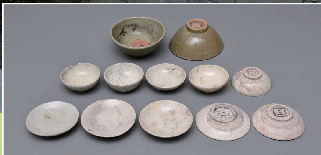
▲柏崎町遺跡土層断面