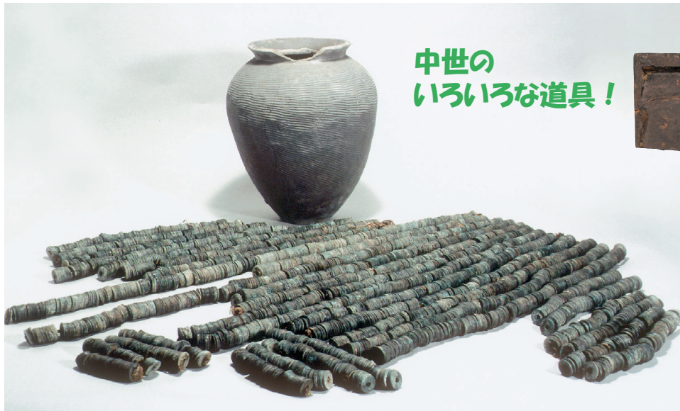
珠洲焼・銭貨 [東原町遺跡]