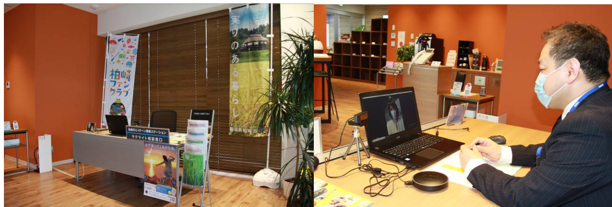
移住相談スペース