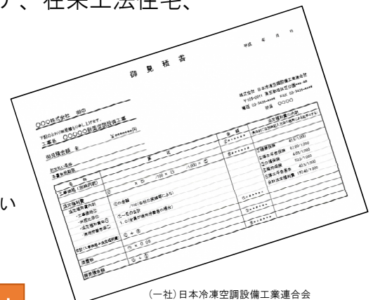
(一社) 日本冷凍空調設備工業連合会