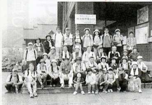
梶池高原トレッキング

地域では、緑の里・水の里・雪の里「野田の四季三世代交流」をキャッチフレーズに事業を進めています。 自然とふれあう緑の美しい地域づくり、健康で元気な体づくり、災害に強い安全・安心の地域づくりを目標に掲げ、楽しく安心して住み続けられる地域づくりに取り組んでいます。