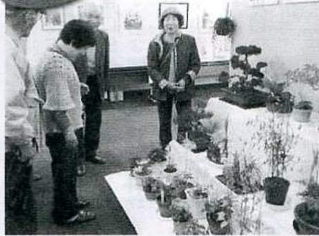
力作ぞろいの作品展