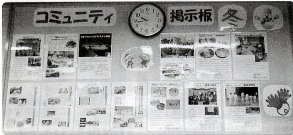
コミュニティ掲示板（12月更新）