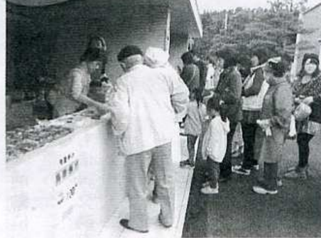
駐輪場の屋台は雨の心配もなく最高!