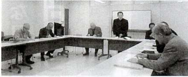
コミュニティ研究委員会

コミュニティ研究委員会とは、コミュニティ40周年を契機にこれまでのコミュニティ施策を見直し、今後のコミュニティ施策に活かすための調査や研究を行うことを目的とした組織です。発足後、最初の活動としてコミュニティに対する市民意識の把握を目的としたアンケート調査を行います。