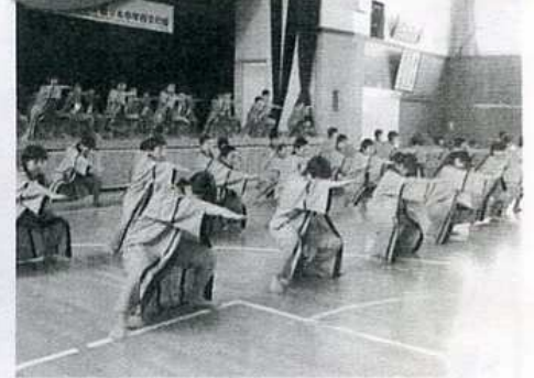
ステージでは北条中全校生徒の「よさこい」