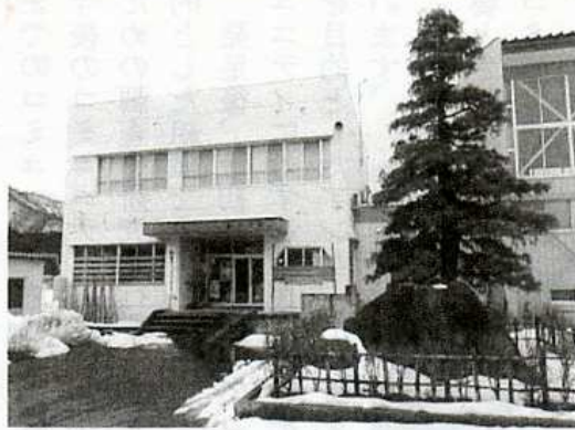
野田コミュニティセンター

野田地区は市内中心部から約11kmほど南に入った国道353号沿いに位置し、9つの町内会でコミュニティを組織しています。自然豊かな環境の中、水田農業を中心とした兼業農家が殆んどです。近年は若者を中心とした就農者が園芸との複合経営で規模拡大を目指して意欲的に農業に取り組んでいます。