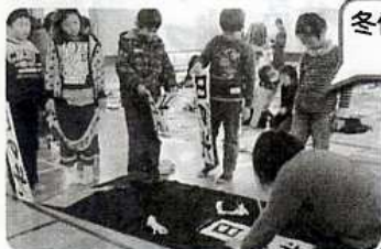
冬休み子ども書道教室（松波）

柏崎市コミュニティ推進協議会（通称「コミ協」とは…） 柏崎市の31地区のコミュニティ協議会が参加し、各地区の地域づくりの中心的役割を担うコミュニティ職員が各コミュニティの抱えている課題の共有化や研修などを通して地域の活性化に取り組むための組織です。