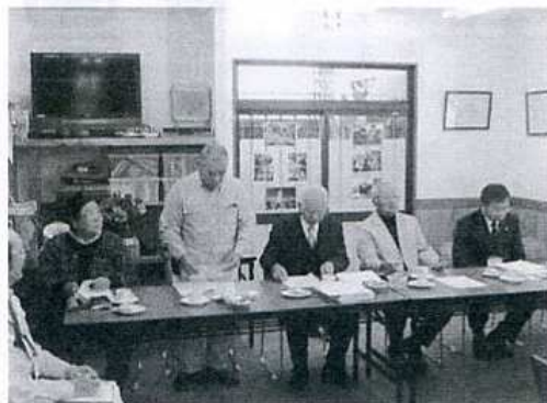
鷺宮コミュニティ推進協議会

が抱えている地域課題と似ているが、背景の異なる課題に取り組みられている状況に、地域づくりの大変さを実感しました。その後、関東最古の大社である鷺宮神社を見学しました。