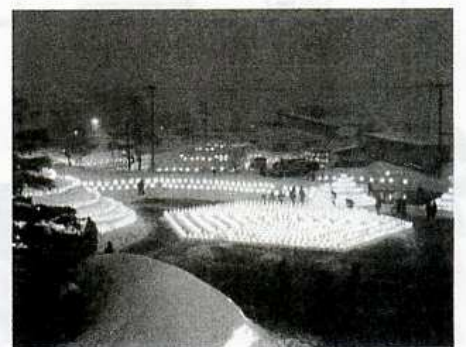
キャンドル・フェスタ