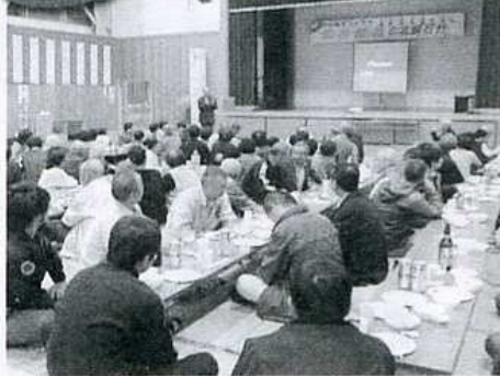
懐かしの地元を振り返る映写会