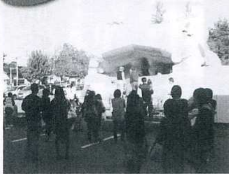
大歓声のふわふわドーム