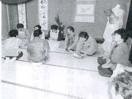
ピンと張りつめた抹茶コーナー