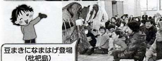
豆まきになまはげ登場（枇杷島）

広報部会では、柏崎駅待合室の掲示板を利用し、コミュニティの活動や取り組み、地域のとっておきの情報などをお伝えする活動を行っています。季節にちなんだ地域の情報やイベント、コミュニティ活動の様子を掲載しております。近くにお出かけの際は、ぜひ待合室の掲示板をご覧ください。