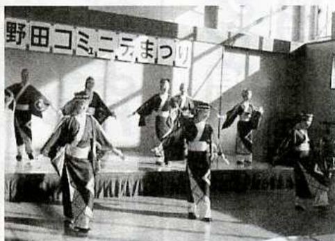
コミュニティまつりのステージ発表

春のコミセン前広場での花見に始まり、潮風マラソンの給水から夏に移り、盆踊り、ぎおん柏崎まつりに参加します。秋は登山・ウォーキング、風土市、コミセンまつりで盛り上がりがあります。冬は新年を迎えてからのどんど焼き、繭玉飾り、天神講、キャンドルフェスタで1年の行事を締めくくります。