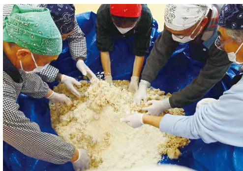
みそ玉作り(塩きり糰につぶし大豆を混ぜる様子)

元産の大豆を使い、糰と塩のみ、 添加物は一切なしの味噌です。 約10ヵ月間熟成させ、コミセン 祭りで販売しています。その評 判は上々で、早々に完売します。 現在は6樽(35kg/樽)を仕込 むほどになりました。