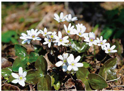
里山に咲く雪割草 (オオミスミソウ)

大田地区は、3つの町内会 (大崎、甲田、浜忠) で構成さ れ、世帯数は138世帯です。