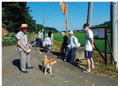
第一次避難場所への避難

ホームは旧石地小学校跡に平成 26年4月に設立されました。そ の直後から、花植え、草刈りな どの環境整備活動を続けていま す。