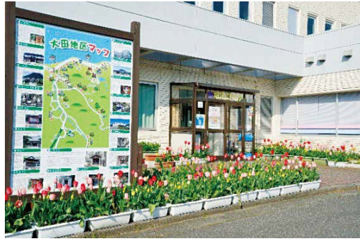
大田コミュニティセンター

大田コミュニティセンターは 柏崎市西山町の海岸沿いに位置 する「西山総合体育館」の一部 をコミュニティセンターとして 利用しています。 「ふれ愛、ささえ愛、よろこ