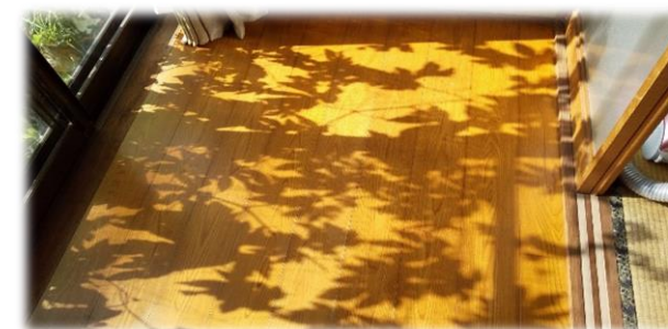
【植物の種類】 ゴーヤ