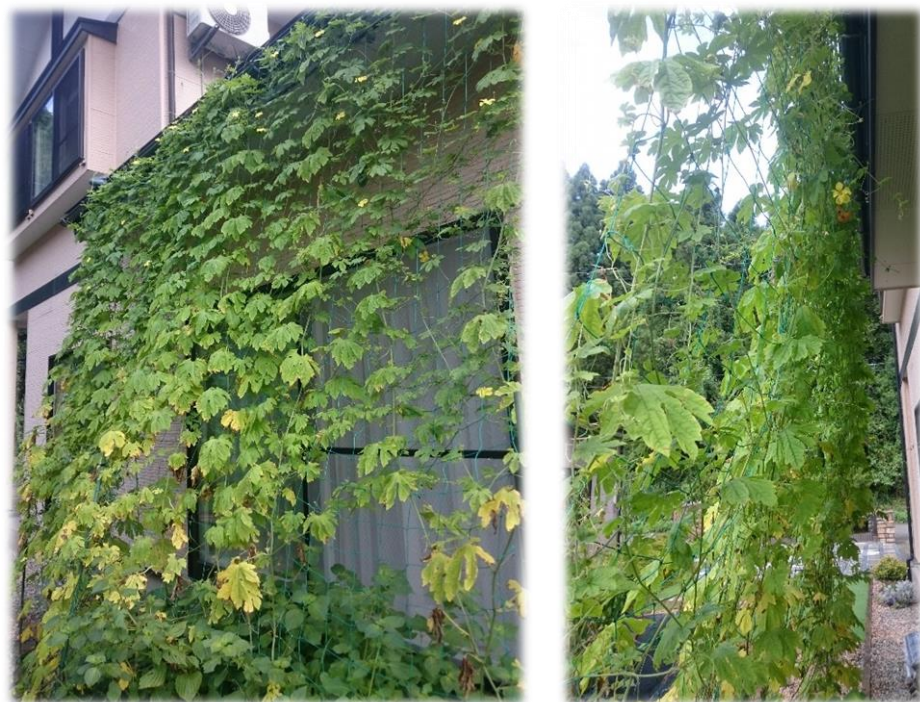
【植物の種類】ゴーヤ