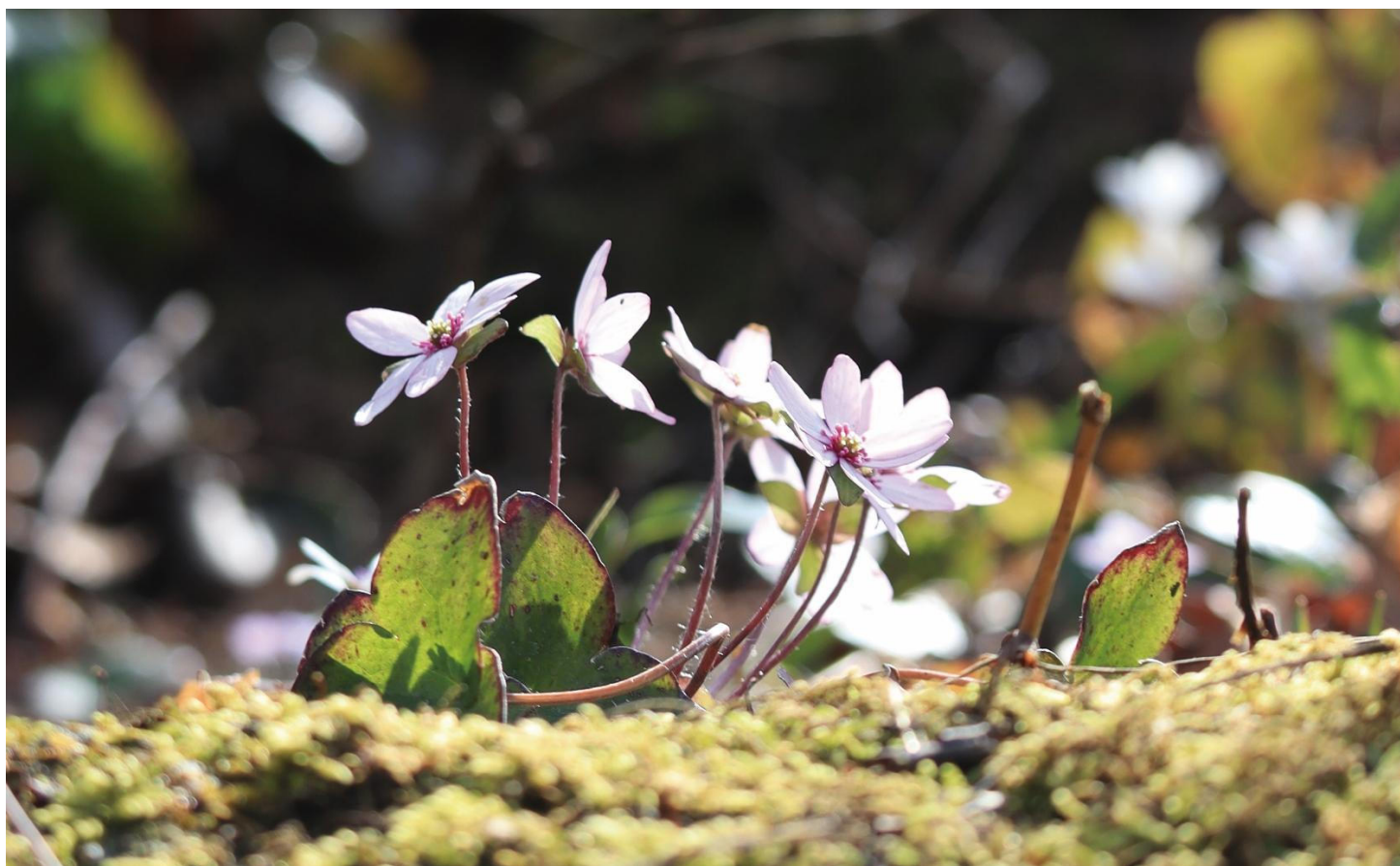
「大崎雪割草の里」の雪割草