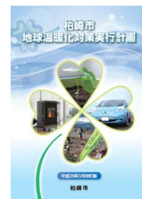
←柏崎市地球温暖化対策実行計画。世界や国の温暖化対策の動きを把握しながら、令和3年度に見直しを実施します。