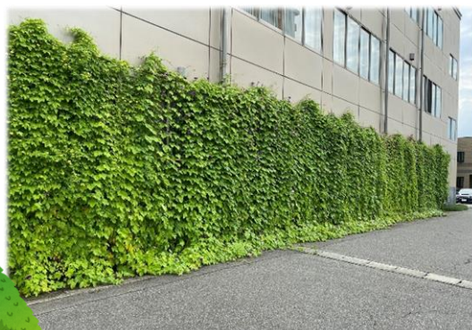
▶(株)イシザカ様 カーテン