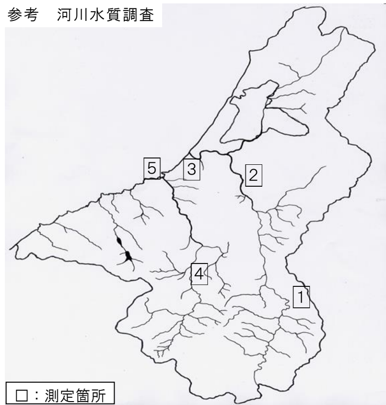
参考 河川水質調査