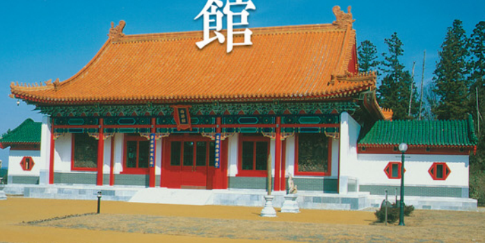
色鮮やかな中国の伝統的な宮廷建築です