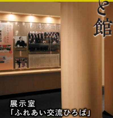
展示室 「ふれあい交流ひろば」