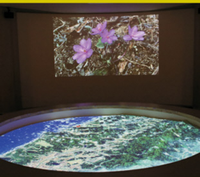
プロジェクションマッピング 西山町の四季折々の風景を立体模型とスクリーンに写し出します

多目的ホール 600席を擁し、 文化・産業の拠点としての役割を 担う多目的ホールです