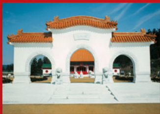
さんざもん 三座門 西遊園入口にある吉祥を表す門です