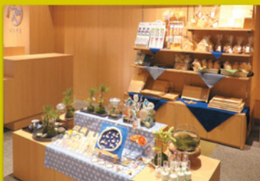
にしやまショップ 道の駅の商業機能として、 地域の特産品や逸品を販売します