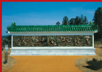
きゅうえんへき 九猿壁 孫悟空の知恵と勇氣に富んだ姿が彫塑されています