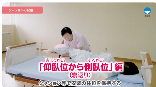
在宅介護に必要な基本介護技術「仰臥位から側臥位」編