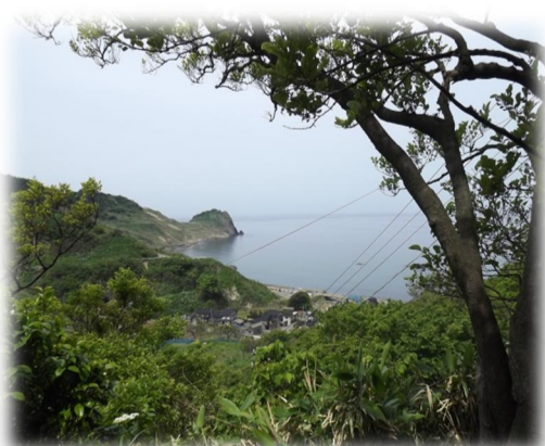
亀割坂からの眺め