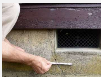
基礎のひびをチェック