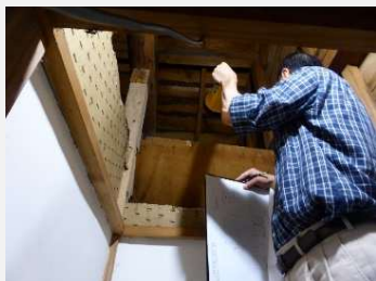
天井裏をチェック

診断士は、床下や天井を覗いて 筋交いや金物の有無、基礎のひび割れ などを確認したり、 住宅の耐震性・劣化状況を診断 します。