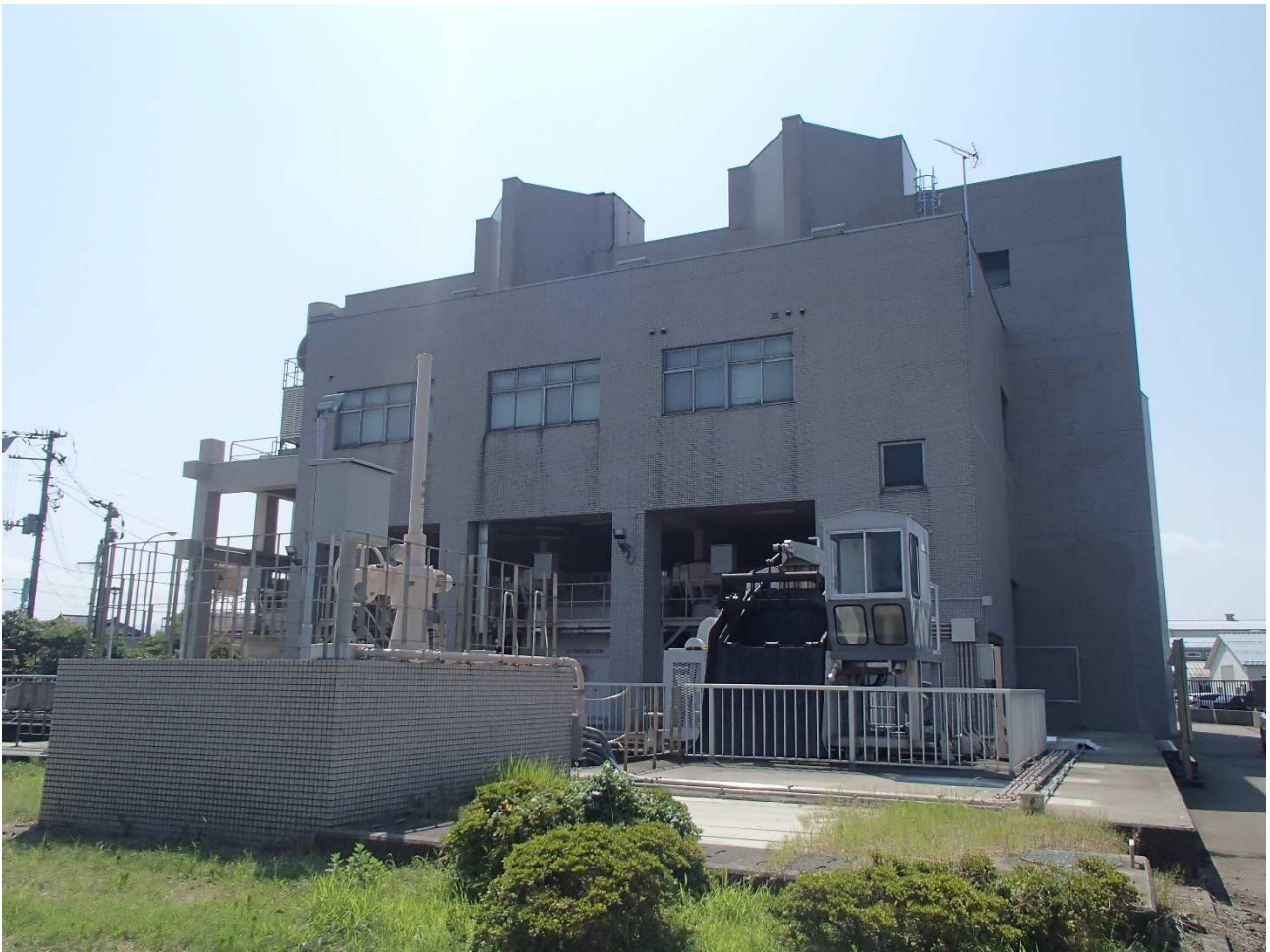
柏崎雨水ポンプ場