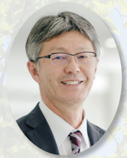
「社会を明るくする運動」 柏崎刈羽地区推進委員会会長 柏崎市長