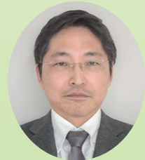
新潟保護観察所 所長