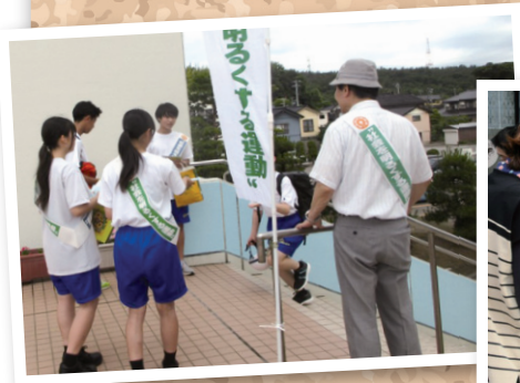
社会を明るくする運動、啓発物を配布