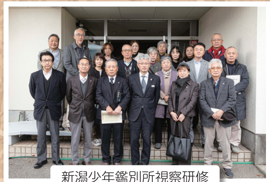
新潟少年鑑別所視察研修