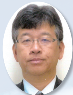
新潟保護観察所 所長