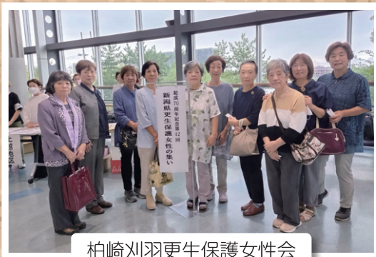
柏崎刈羽更生保護女性会