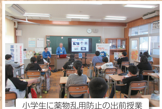
小学生に薬物乱用防止の出前授業