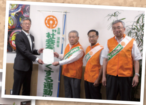
内閣総理大臣 メッセージの伝達