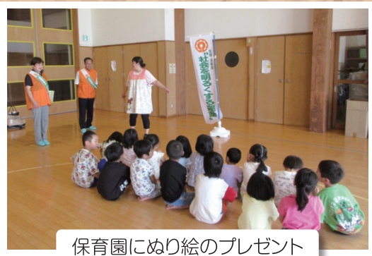
保育園にぬり絵のプレゼント