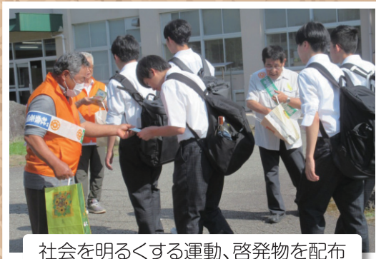
社会を明るくする運動、啓発物を配布