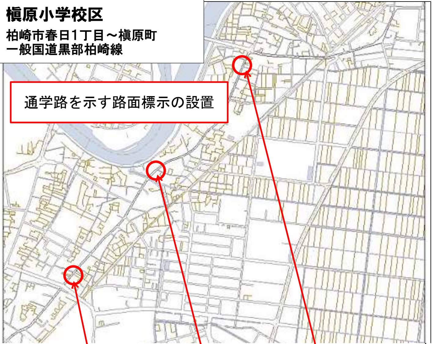
対策状況写真 (平成28年10月11日施工)