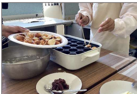
ベビーカステラを作りました♪