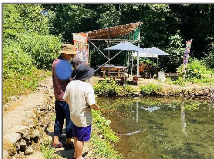
夏休みは谷根でかわあそび!