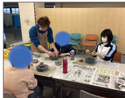
陶芸家の先生を招いて、陶芸体験をすることもあります。