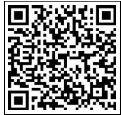
就学相談申込用フォーム