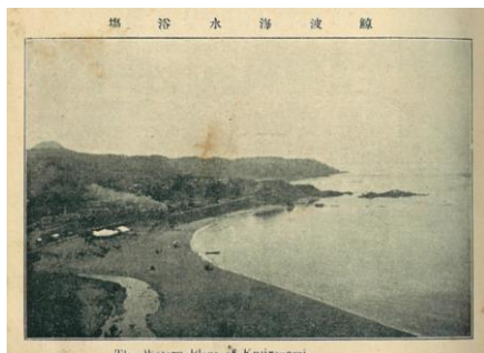
北越鉄道案内 鯨波海水浴場