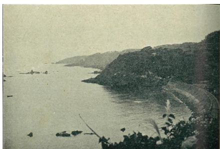
北越鉄道案内 米山第六隧道

そして、鉄道旅のお供に欠かせないのが駅弁! 駅弁の始まりは諸説ありますが、一説によると宇都宮で旅館がおにぎり2つとたくあん2切れのお弁当を売り始めたのがきっかけとされているのだとか。味わい深い2時間の旅。受講していただいた皆様、ありがとうございました。