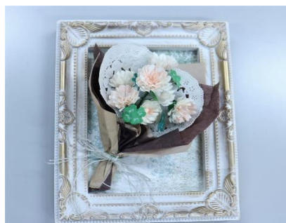
シニアコース「パンチで作る! ~立体のお花~」受講生の作品です。素敵な花束ができました♡

は新型コロナウイルス感染症対策をしつつ各種事業を実施し、こうして市民プラザ通信も計4号発行することができました。4月からはシニア・エイジレスコースの募集が始まります。来年度も、魅力ある事業を企画・運営していきます! 皆様ぜひお楽しみに♪