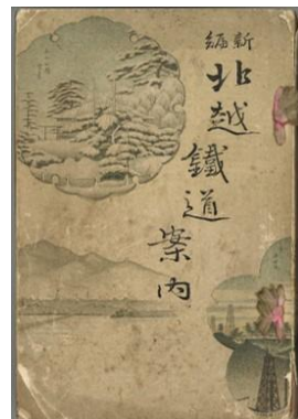
北越鉄道案内の表紙