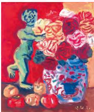
梅原 龍三郎 「薔薇花コブトブロンズ」

柏崎ふるさと応縁基金寄付金により市が購入した美術品を展示します。珠玉の名作をご覧ください。