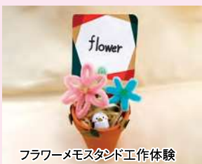
フラワーモースタンド工作体験