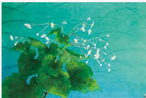
牧 進 「秋海棠」