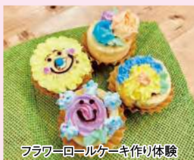
フラワーロールケーキ作り体験

2026.2.5 (木) ~ 11 (水・祝) の間 宿泊料金 10% 割引 ※電話での予約限定