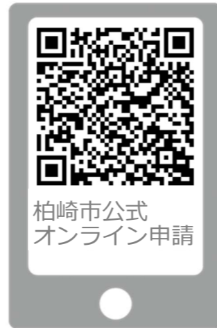
柏崎市公式 オンライン申請