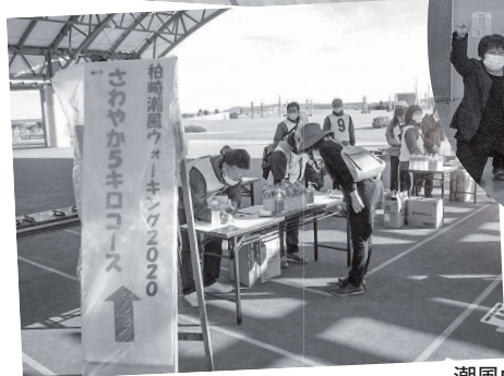
潮風ウオーキング