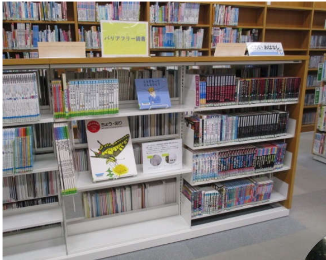
児童書だけでなく、一般書も併せて配架してあります

短くわかりやすい文章、ピクトグラム、イラスト、写真を使い、理解しやすい工夫がしてあります