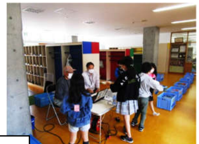
小学校での貸出の様子 気になる本を探します

※平成30（2018）年度：約15万円分89冊、令和元（2019）年度：約10万円分47冊の寄贈