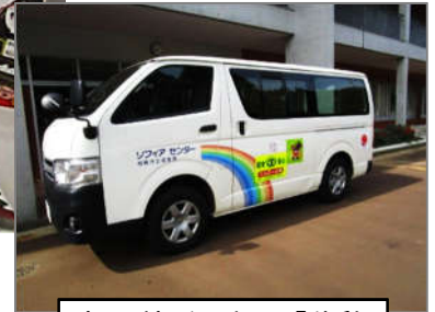
虹の絵が目印の「移動図書館」車で小学校を巡回します

新潟県労働金庫柏崎支店推進委員会様から約12万円分、102冊の児童向け書籍をご寄贈いただきました。これは、新潟県労働金庫柏崎支店推進委員会様の寄付活動の一環であり、今年度で3年目（※）となります。