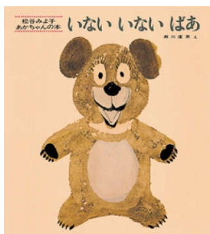
「いない いない ばあ」 松谷 みよ子／ぶん 瀬川 康男/え 童心社 絵本 (E9 セカ)