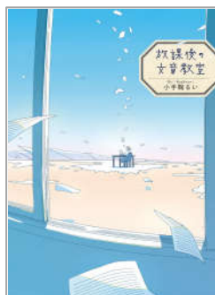
「放課後の文章教室」 小手鞠るい／著 偕成社 児童書・ティーンズコーナー (816 コ)

長く愛され読み継がれている絵本です。ぜひご家族の声で赤ちゃんに読み聞かせてみてはいかがでしょう。※柏崎市ブックスタート事業対象絵本