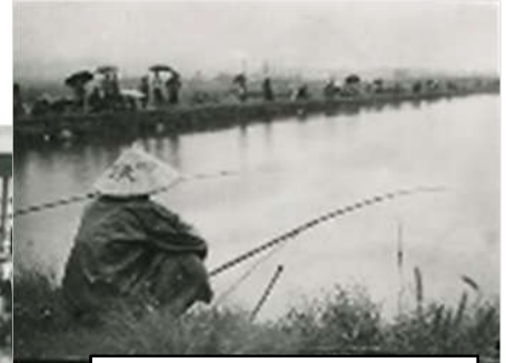
ねずみ塘で魚釣り 遠くに 日本石油の製油所も見える

報道写真家真貝新一氏は、明治29（1896）年、市内宮川に生まれ、10代の頃から独学で写真技術を身につけた。大正13（1924）年、長岡の北越新報社に入社。柏崎支局長を務めた後、戦時の地方新聞統合により新潟県中央新聞、上越新聞、新潟日報の支局長を歴任。戦後は一時新聞社を離れるものの、その後、新潟日報柏崎専売所を経営した。