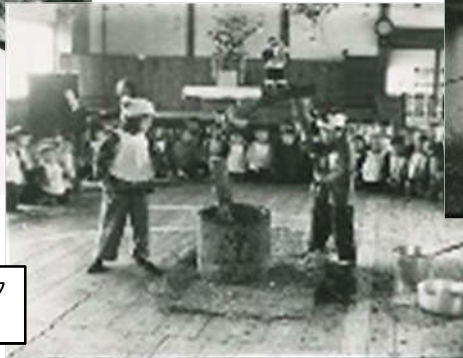
餅つき大会 後ろにサンタ クロースも見える