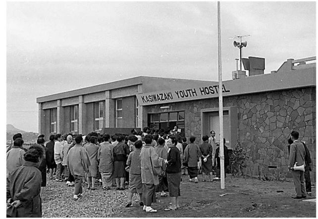
柏崎ユースホテル (昭和 41 年)

表写真 上：柏崎駅前(昭和 45 年)、右下上段：消防訓練、中段・下段：柏崎祭 (すべて昭和 38 年)