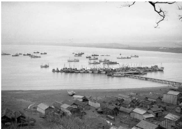
柏崎港 (昭和 35 年)

知っている方には懐かしく、知らない方には新鮮に映る数々の光景を、ぜひご鑑賞ください。