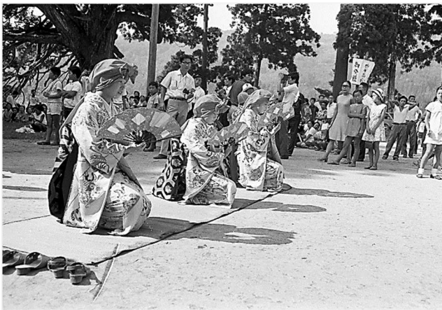
綾子舞 (昭和 45 年)