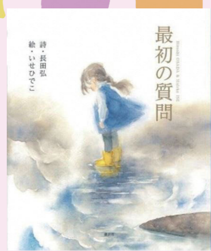
「最初の質問」(E9 イセ) 長田弘/詩 いせひでこ/絵 講談社

見知らぬ(未知の)「道」を行く、子どもの頃のあのドキドキ感と、「前と後ろ」もない、どこからどう読んでもよい自由さがあります。色彩にあふれた夢のような世界を味わってみませんか。