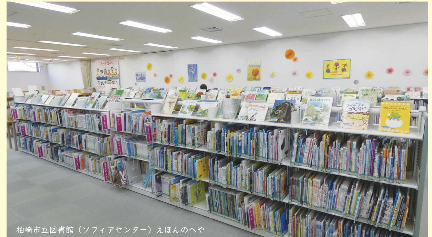
柏崎市立図書館（ソフィアセンター）えほんのへや