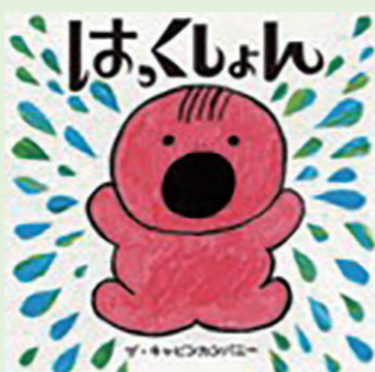
「はっくしょん」(E9 サキ) ザ・キャビンカンパニー/作 岩波書店

新潟県の昔話です。「～すけ」などの方言が入った語り口が懐かしく、読み聞かせをするに身体に馴染む感覚があります。古事記の神話にも見られる普遍的な型を持つこのお話。恐怖に打ち勝つストーリーは、子どもの心を惹きつけ、また安心させるものがあります。