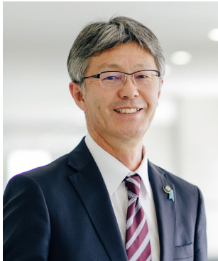
柏崎市長 桜井雅浩