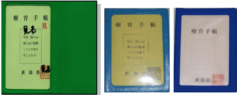
既存の手帳 (順次更新) 新潟市以外の市町村発行 新潟市発行