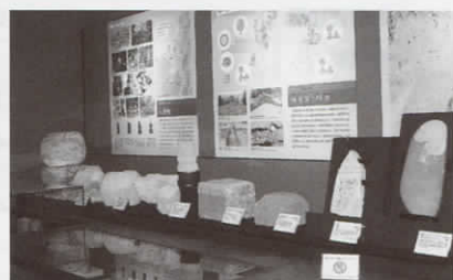
人文展示室(考古)石造物コーナー

写真の四角い石は、 ほうきょういんとう 宝篋印塔という供養などのために建てられた石塔の一部で、 きそ 基礎と呼ばれる部分です。新潟県内には、鎌倉～室町時代の宝篋印塔が点在しています。