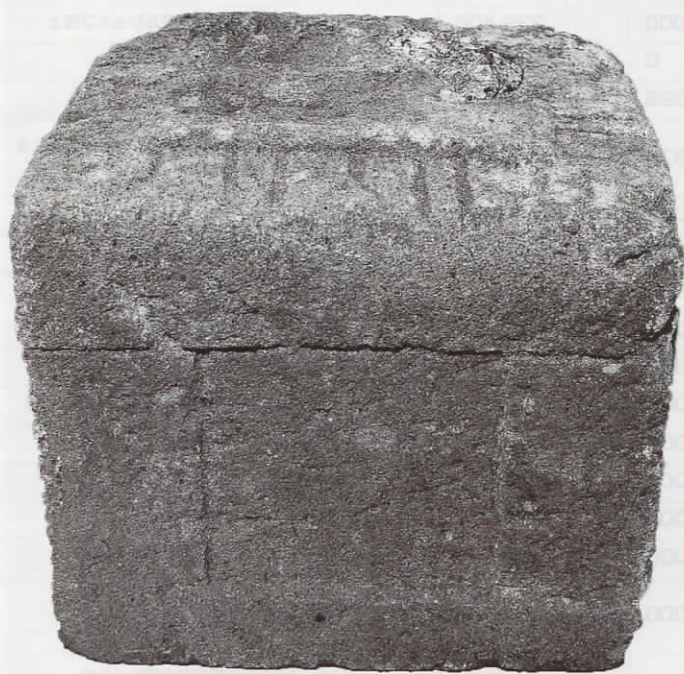
飛岡大坪のダイラ出土の宝篋印塔(基礎)