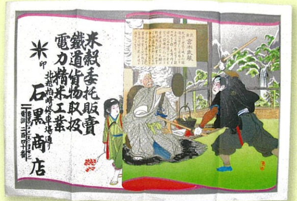
▲神話や歴史を題材とした場面の描写は読み物としても楽しませてくれました。(当館蔵)