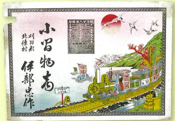
▲お金でできた列車がソロバンの線路を走る。ユニークな図柄も特徴です。(個人蔵)