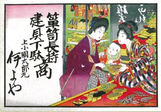
▲商店の店先での様子が色彩豊かに描かれています。(当館蔵)

本展では、柏崎をはじめ県内各地の引札を展示し、そこから見える人々の暮らし、興味や関心、願いなどを読み解きます。あわせて、印刷や広告の歴史の一端についても紹介します。見ているだけでも楽しい、華やかな刷り物の世界をお楽しみください。