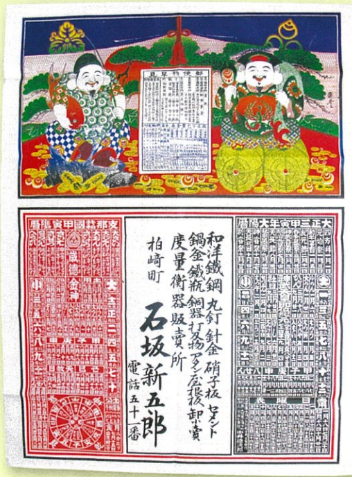
▲暦や郵便物早見が掲載された引札は実用的で重宝されました。(当館蔵)