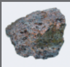
大鉄塊 (下ヶ久保A遺跡)