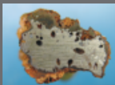
鉄塊断面 (下ヶ久保A遺跡)