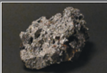
現代の玉鋼 (個人蔵)