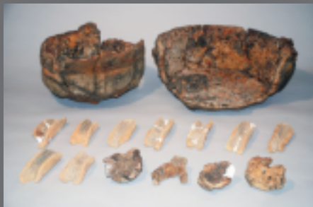
鑄造関連遺物 (下ヶ久保A遺跡)