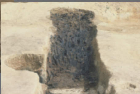
木炭窯 (下ヶ久保C遺跡)