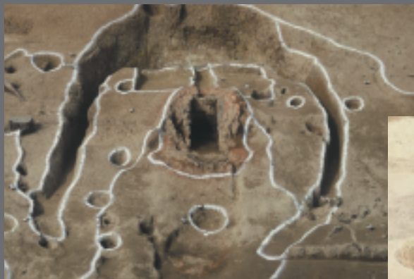
製鉄炉 (シヨリ田B遺跡)