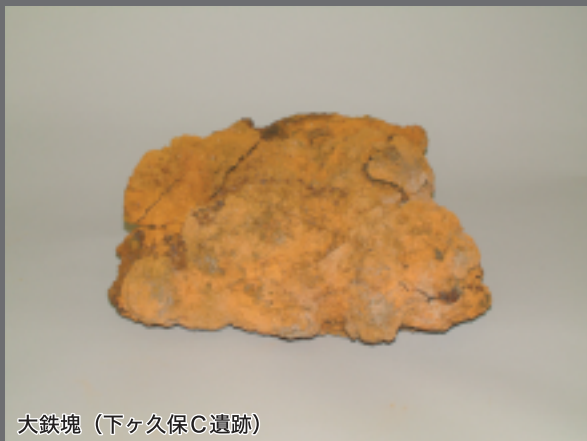
大鉄塊 (下ヶ久保C遺跡)