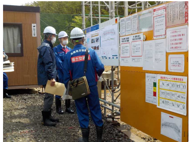
令和3(2021)年4月30日 市長が8号柏崎バイパス工事現場(トンネル)を視察