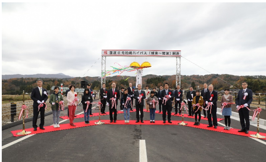
国道 8 号柏崎バイパス (城東～鯨波) 開通式 (令和 4 (2022) 年 11 月 27 日撮影)