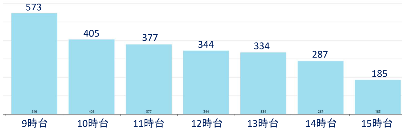
時間帯別利用者数(人)

利用者数[A]: 2,505人 運行日数[B]: 33日 平均利用者数[A/B]: 75人/日