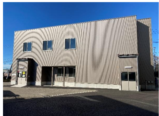
軽量鉄骨造 2階建て