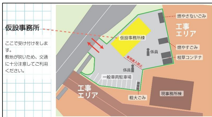
平面図(広報かしわざき10月号)