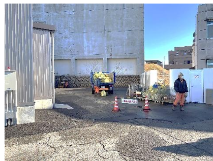
燃やすごみ・燃やさないごみ