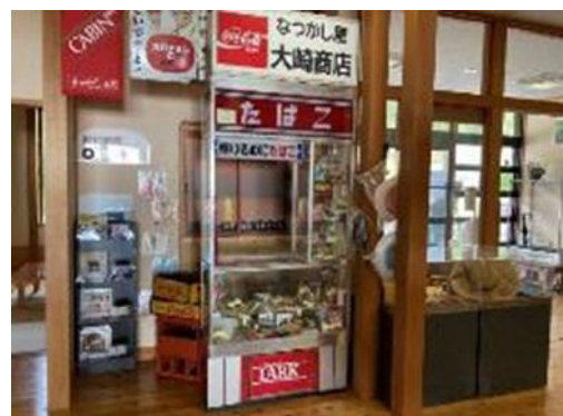
昭和レトロコーナー「なつかし屋大崎商店」