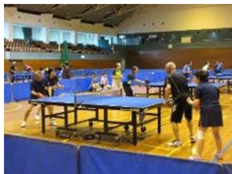
ラージボール卓球交流会