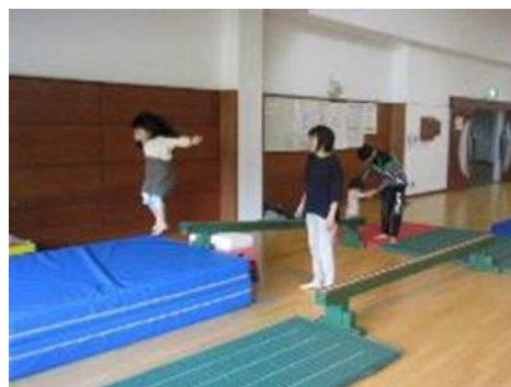
親子運動あそび教室