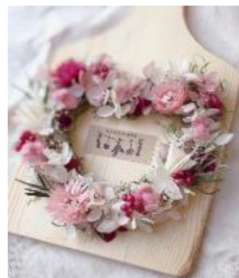
カルチャー教室 「お花の雑貨」