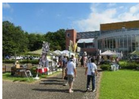
西山クラフトビールまつり

道の駅西山ふるさと公苑においては、感染防止対策を十分に行い、「西山クラフトビールまつり」や「キッチンカーまつり」等の飲食を中心としたイベントを積極的に実施し集客に努めました。また、年間を通し多彩なイベントを各種団体と協力して行い、つるし