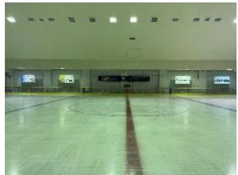
アイスリンク広告事業