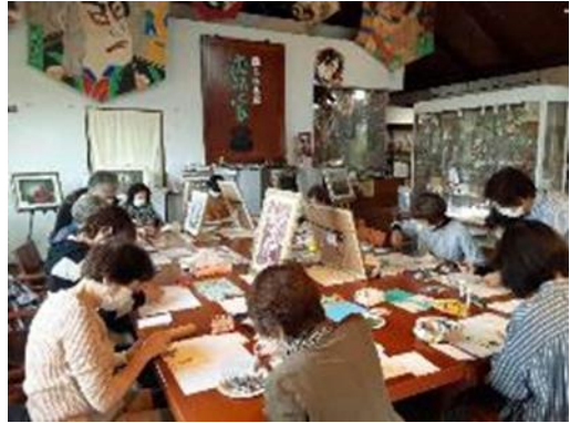
押し花ワークショップ