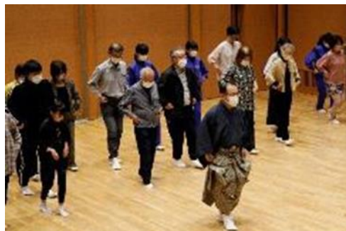
ワークショップ~ようこそ、狂言の世界へ~

また、ピアノ演奏体験を始めとする各種体験事業を行い、ホール施設に関心を持ってもらう機会を企画しました。